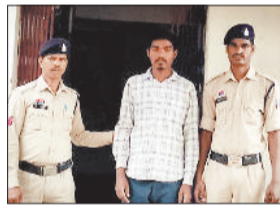
पुलिस गिरफ्तार में आरोपी।