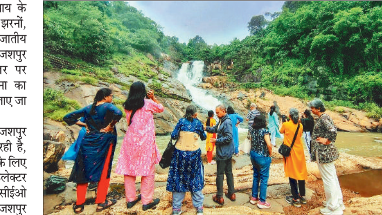
पर्यटन स्थल का भ्रमण करते पुणे के पर्यटक।