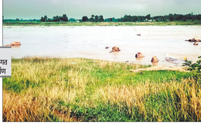
पुल निर्माण के लिए प्रस्तावित स्थल।

मुख्यमंत्री विष्णुदेव साय के नेतृत्व में जिले के विकास कार्यों को नई गति मिल रही है। लंबे समय से लंबित मांग अब पूरी होने जा रही है। फरसाबहार क्षेत्र के लिए यह किसी वरदान से कम नहीं है। मुख्यमंत्री विष्णुदेव साय ने धीरसांड से दाईजबहार मार्ग पर ईब नदी पर उच्च स्तरीय पुल एवं पहुंच मार्ग निर्माण के लिए 9 करोड़ 18 लाख रुपए की प्रशासकीय मंजूरी प्रदान की है। यह निर्माण कार्य निविदा प्रक्रिया पूर्ण होने के पश्चात शीघ्र ही प्रारंभ किया जाएगा। पुल बन जाने से क्षेत्र के हजारों ग्रामीणों को सीधा लाभ मिलेगा और वर्षों से महसूस की जा रही बड़ी आवश्यकता पूरी होगी।