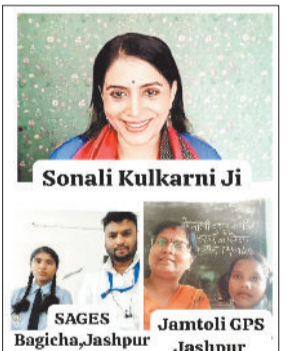
Sonal Kulkarni Ji