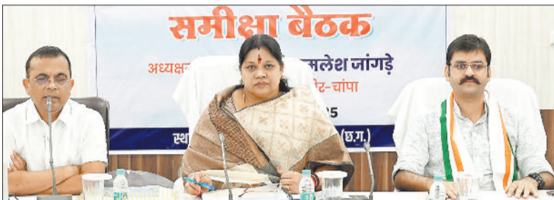
अधिकारी कर्मचारियों की बैठक लेते सांसद, कलेक्टर व विधायक

लोकसभा क्षेत्र जांजगीर-चांपा सांसद श्रीमती कमलेश जांगड़े की अध्यक्षता में जिला विकास समन्वय एवं निगरानी समिति (दिशा) की बैठक जिला पंचायत सभाकक्ष में मंगलवार 16 सितंबर को आयोजित हुई। उन्होंने बैठक में केंद्र प्रवर्तित योजनाओं के क्रियान्वयन की गहन समीक्षा की और बेहतर कार्यान्वयन के लिए अधिकारियों को आवश्यक दिशा-निर्देश दिए। सांसद श्रीमती जांगड़े ने दिशा समिति की बैठक में योजनाओं की प्रगति पर बिंदुवार चर्चा की और अधिकारियों से जानकारी ली। इस दौरान सांसद ने हितग्राहियों को जनसंपर्क अनुदान राशि का चेक वितरण किया। सांसद ने सरकार की योजनाओं का लाभ अंतिम व्यक्ति तक पहुंचाने के निर्देश दिए। उन्होंने किसानों को सुविधाओं के लिए सहायता केन्द्र स्थापित करने