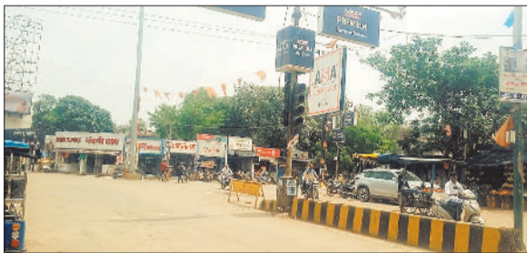
कचहरी चौक में बंद ट्रैफिक सिग्नल।

गौरतलब है कि जिला मुख्यालय जांजगीर के कचहरी चौक, नेताजी चौक, केरा रोड, अटल चौक सहित अन्य प्रमुख मार्गों पर ट्रैफिक सिग्नल लगाया गया है। ताकि वाहन चालक सहित आम सवार लोग भी यातायात नियमों का पालन करते हुए अपने वाहनों का परिचालन करें। इधर जांजगीर शहर की ट्रैफिक सिग्नल व्यवस्था लंबे समय से खराब हो चुकी है। वही इसके मरम्मत एवं रखरखाव को लेकर ध्यान तक नहीं दिया जा रहा है। जिसके कारण आने जाने वाले लोगों को काफी परेशानी उठानी पड़ती है। इधर शहर के विगडे ट्रैफिक सिग्नल के कारण लोगों को आवागमन करने में काफी परेशानी हो रही है। शाम के वक्त तो कचहरी चौक, नेताजी चौक सहित अन्य जगहों पर जाम की स्थिति