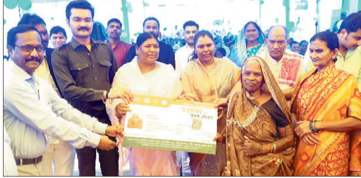
महिलाओं को प्रदान किया गया आयुष्मान कार्ड।